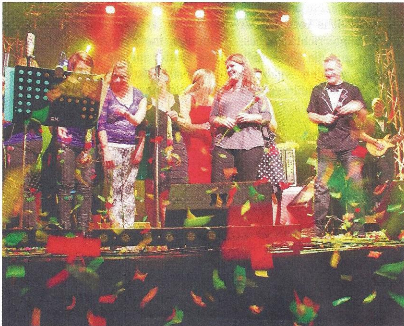
Die Solistinnen verabschieden sich vom Publikum.

Waldenburg | Der erfolgreiche Musikanlass ist zehn Jahre alt